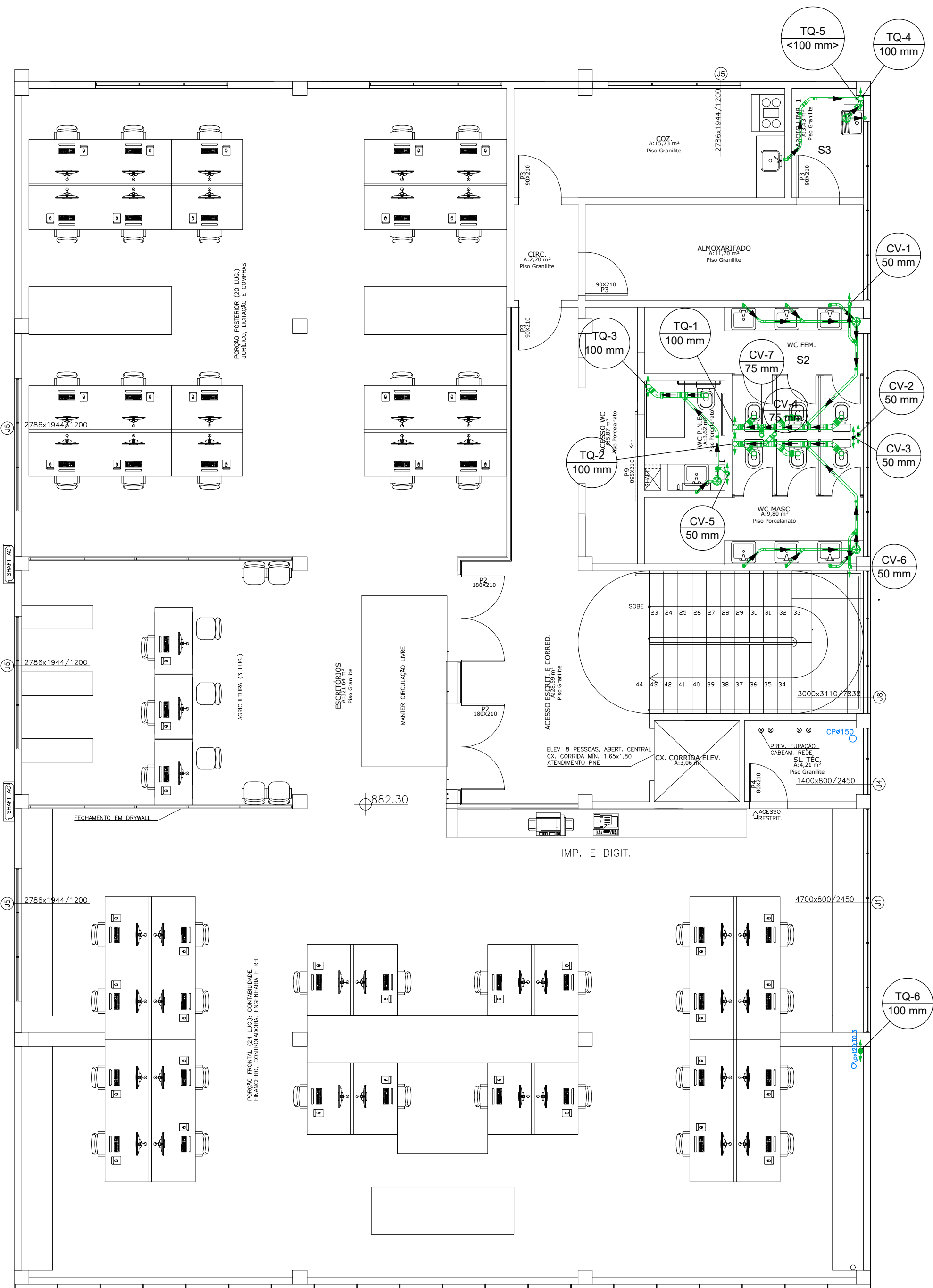
PLANTA BAIXA 1º PAV. ESCALA 1:75